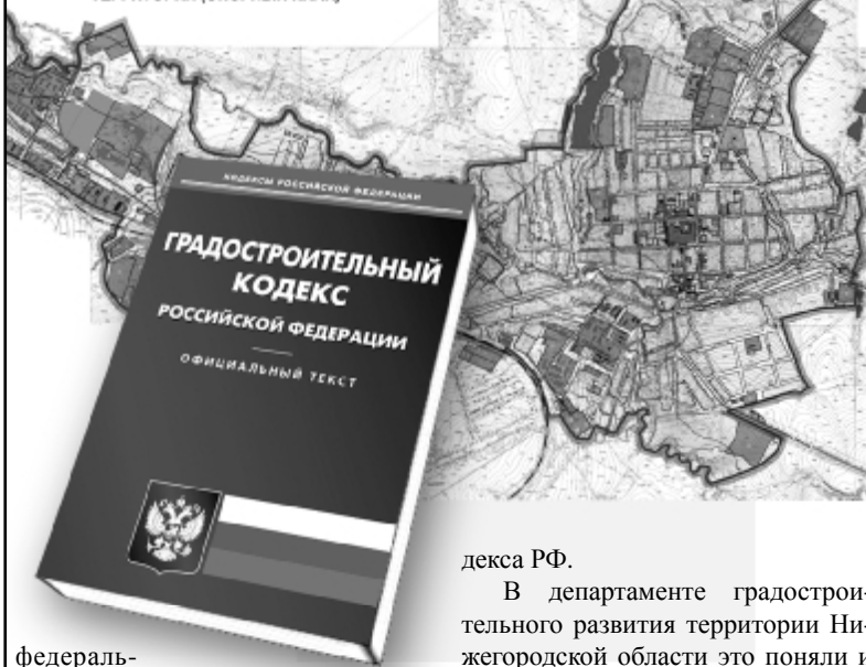
г. ЛУКОЯНОВ ГЕНЕРАЛЬНЫЙ ПЛАН ПЛАН СОВРЕМЕННОГО ИСПОЛЬЗОВАНИЯ ТЕРРИТОРИИ (ОПОРНЫЙ ПЛАН)

федеральным органом исполнительной власти». Знали ли об этом руководители района целый год пытающиеся «продавить» принятие генплана с множеством ошибок и неточностей? Видимо, не знали, потому как и подготовка, и утверждение генерального плана городского поселения прошли с нарушениями статьи 24 Градостроительного кодекса (о чем наша газета писала неоднократно).